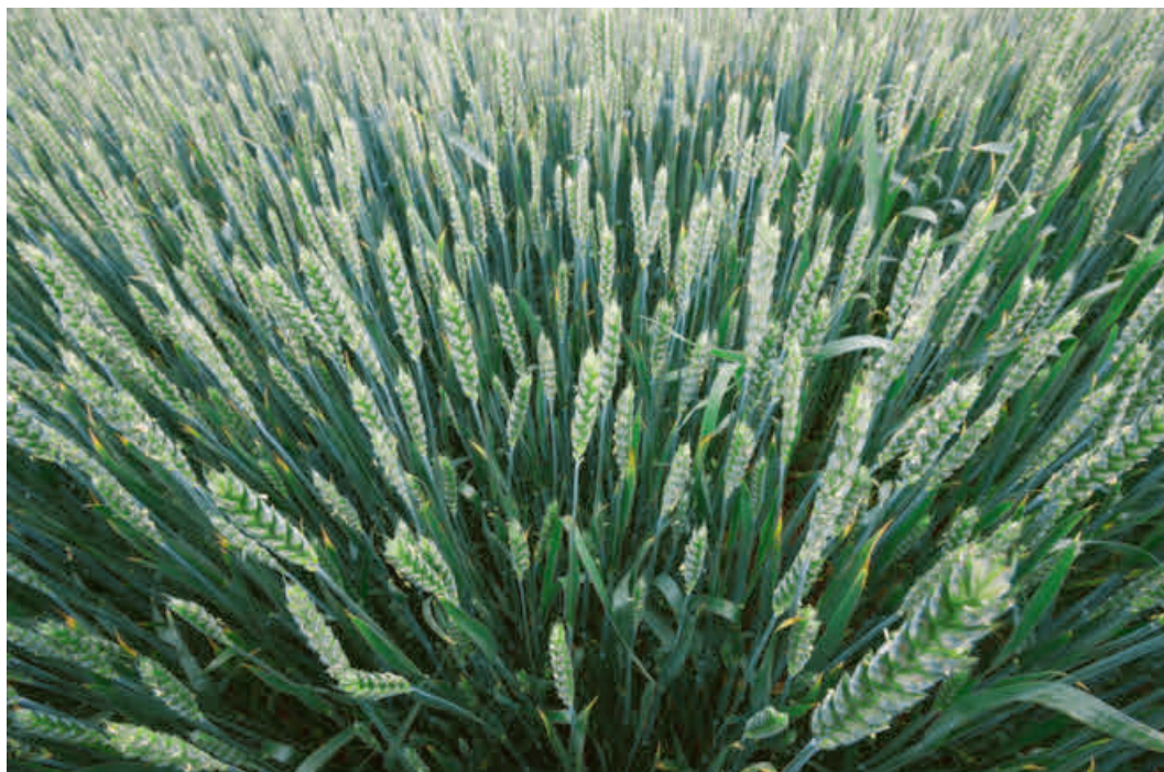
Gesunder Weizen: UZH-Forschende haben Weizen entwickelt, der gegen Mehltau resistent ist.