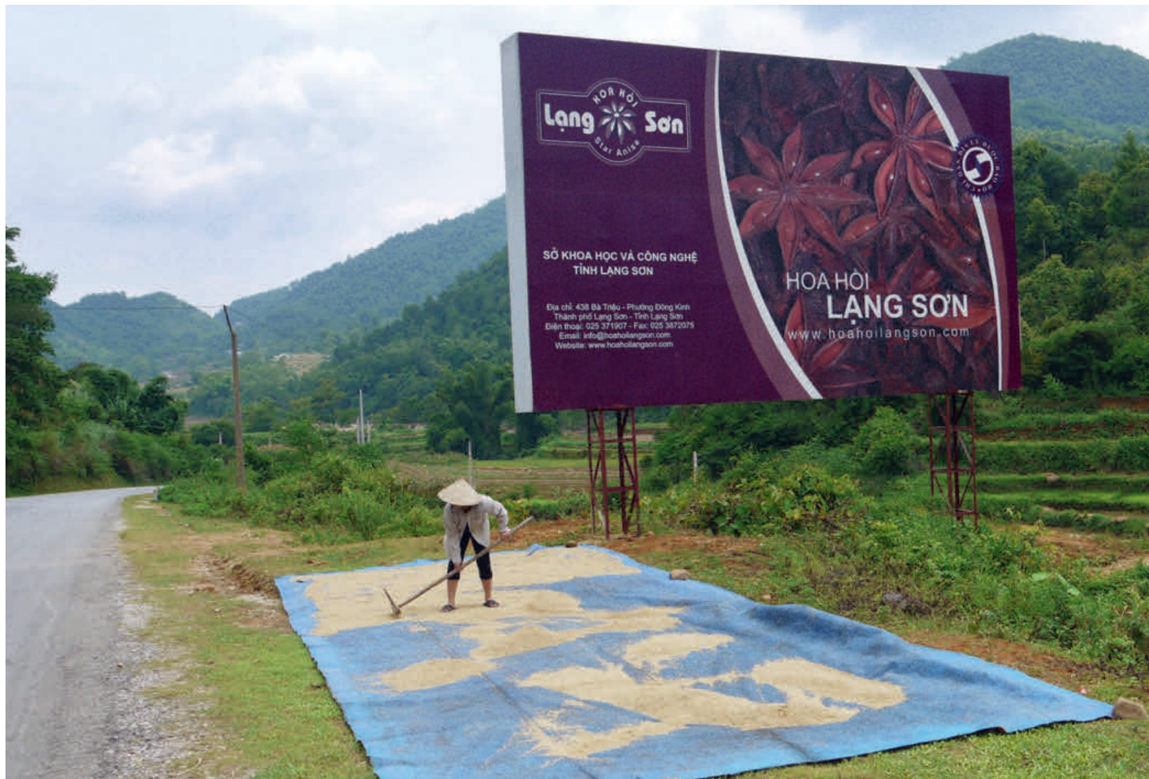
Wohlriechendes Gewürz: Sternanis wird in Vietnam vor allem in Lang Son, einer Bergregion im Nordosten des Landes, angebaut.