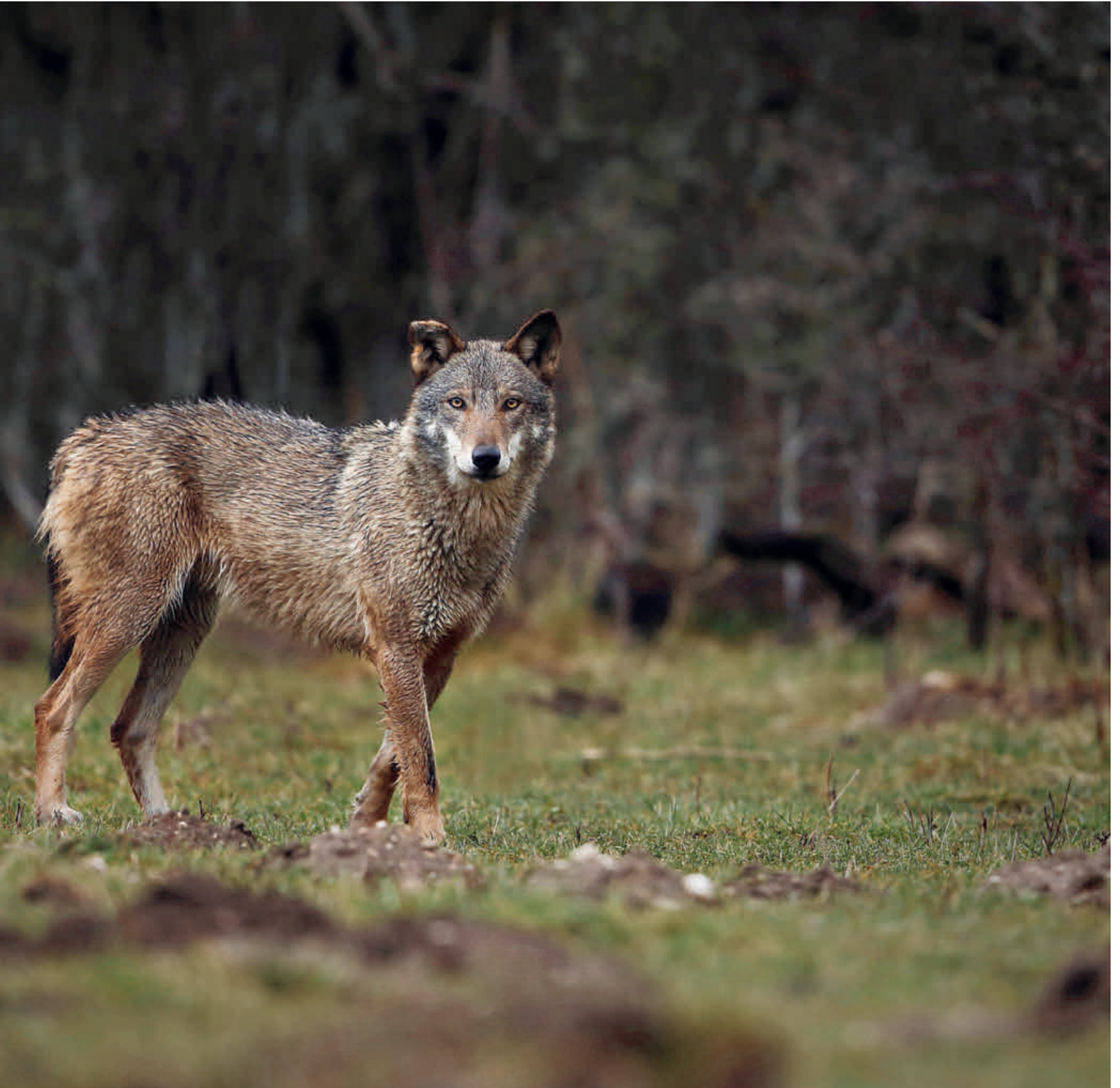
Raubtiers hat zu heftigen Debatten geführt.