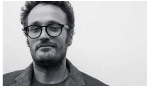
Hat Kinder auf der ganzen Welt porträtiert: James Mollison.

Um Chancen auf ein gutes Leben geht es auch im Dossier dieses Hefts. Wissenschaftlerinnen und Wissenschaftler an der UZH erforschen Ungleichheit und überlegen sich, was