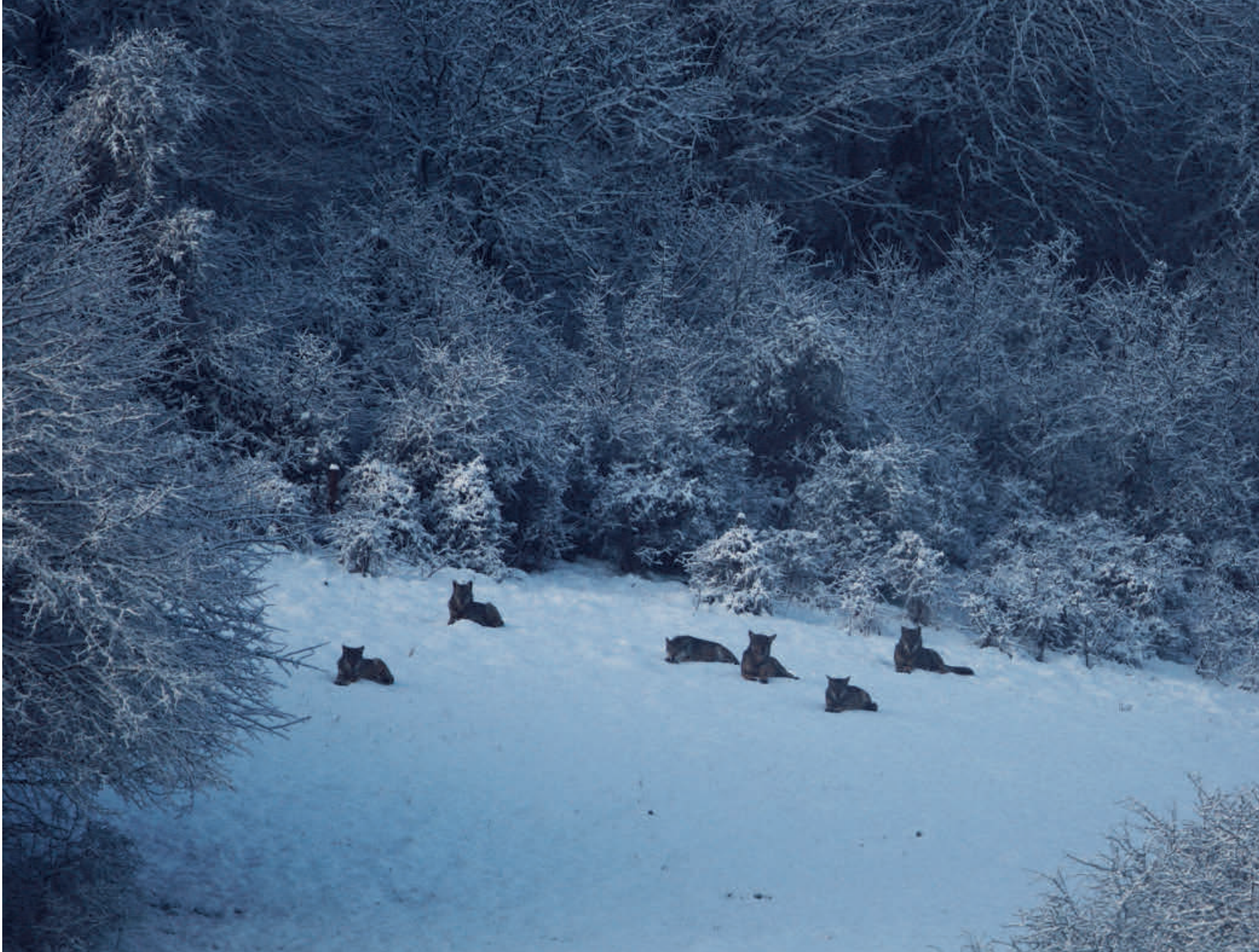
Unterschiedlich akzeptiert: Während der Wolf im Wallis unerwünscht ist, wird er in Teilen Graubündens und im Jura durchaus willkommen geheissen.

Fahne geschrieben haben: die Agrarpolitik, die den Bauern die Pflege der Kleinviehzucht auferlegt, und die Umweltpolitik, die den seit 1979 unter Schutz gestellten Wolf zulassen will.