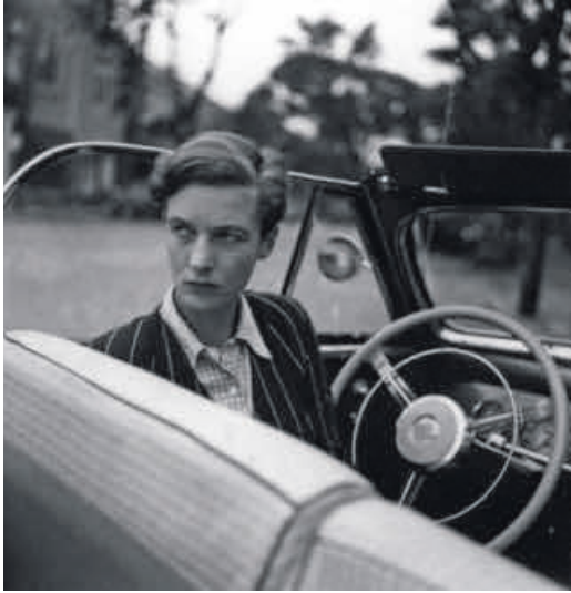
Reisen, schreiben, fotografieren: Annemarie Schwarzenbach.