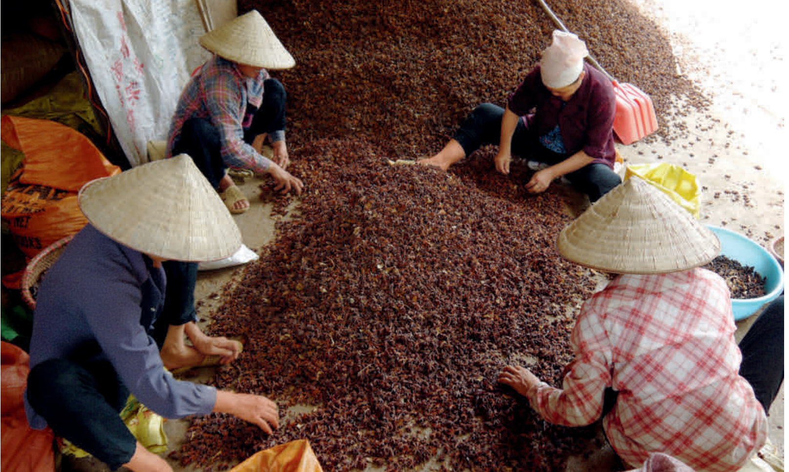
Schwankende Preise, wenig Marktwissen: Sternanis ist für die vietnamesischen Bauern ein unsicheres Geschäft.

Grundnahrungsmittel kostete zu diesem Zeitpunkt rund einen Dollar pro Kilogramm. Über die Jahre hinweg sind die Preise schliesslich gefallen: Verschiedene Anbieter, insbesondere aus China, drängten sich auf den internationalen Markt.