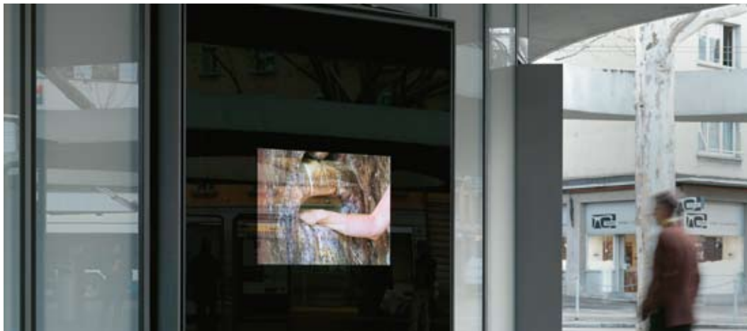
Künstlerische Intervention – Harun Farockis Videoinstallation am Zürcher Limmatplatz.