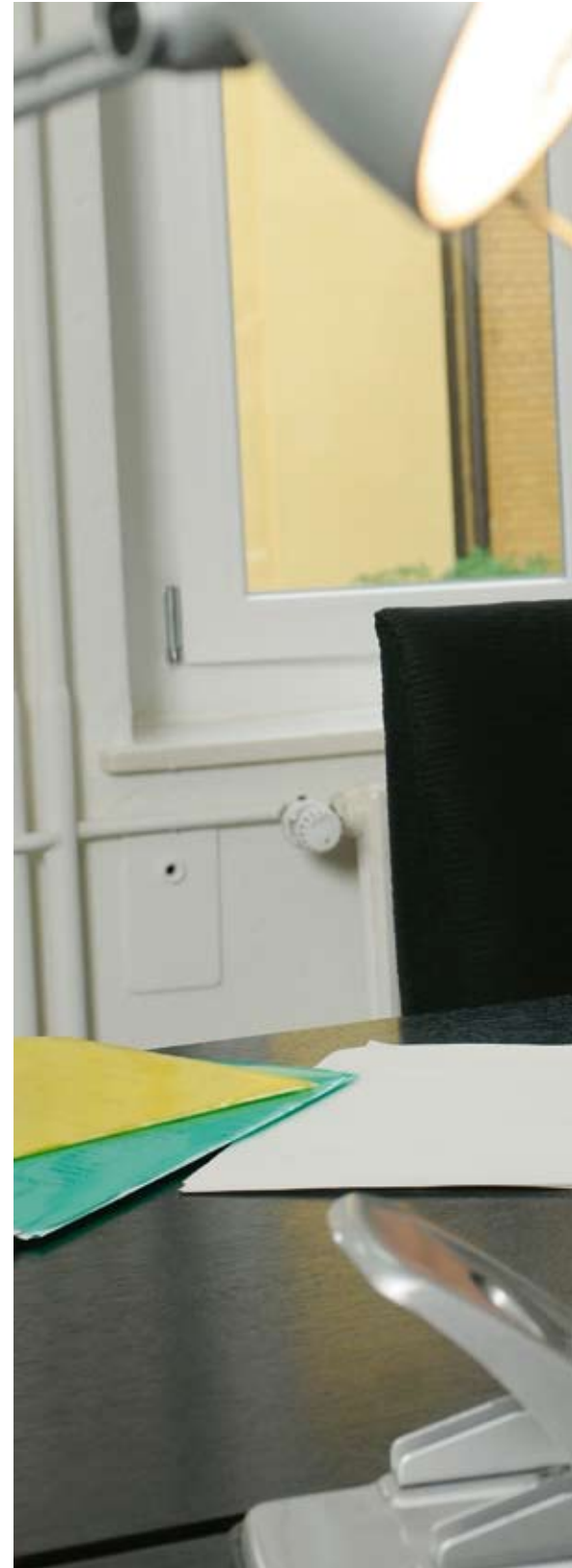
Zurück am Arbeitsplatz müssen die jungen Mütter

«Wir gehen davon aus, dass sich die Berufsrückkehrerinnen umso besser bei der Arbeit integrieren, je positiver sie von ihrem Umfeld unterstützt werden», erklärt Christine Seiger, Doktorandin im Projekt. Der Partner ist dabei die wohl wichtigste Person aus dem privaten Umfeld, aber auch Verwandten und Freunden kann eine wichtige Funktion zukommen. «Allerdings ist es zentral, dass die Frauen auch ihre Eigenverantwortung sehen und wahrnehmen. Dazu gehört auch eine ehrliche Standortbestimmung über mögliche Defizite im fachlichen Knowhow, beispielsweise aufgrund der technologischen Weiterentwicklungen wäh-