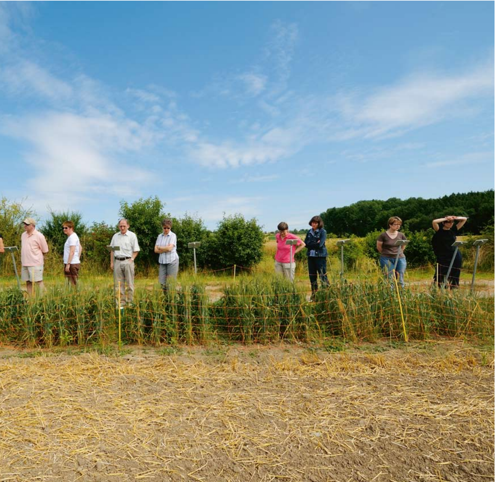
schungsanstalt Agroscope Reckenholz zeigen auf, worum es bei den Freisetzungsversuchen mit gentechnisch verändertem Weizen geht.