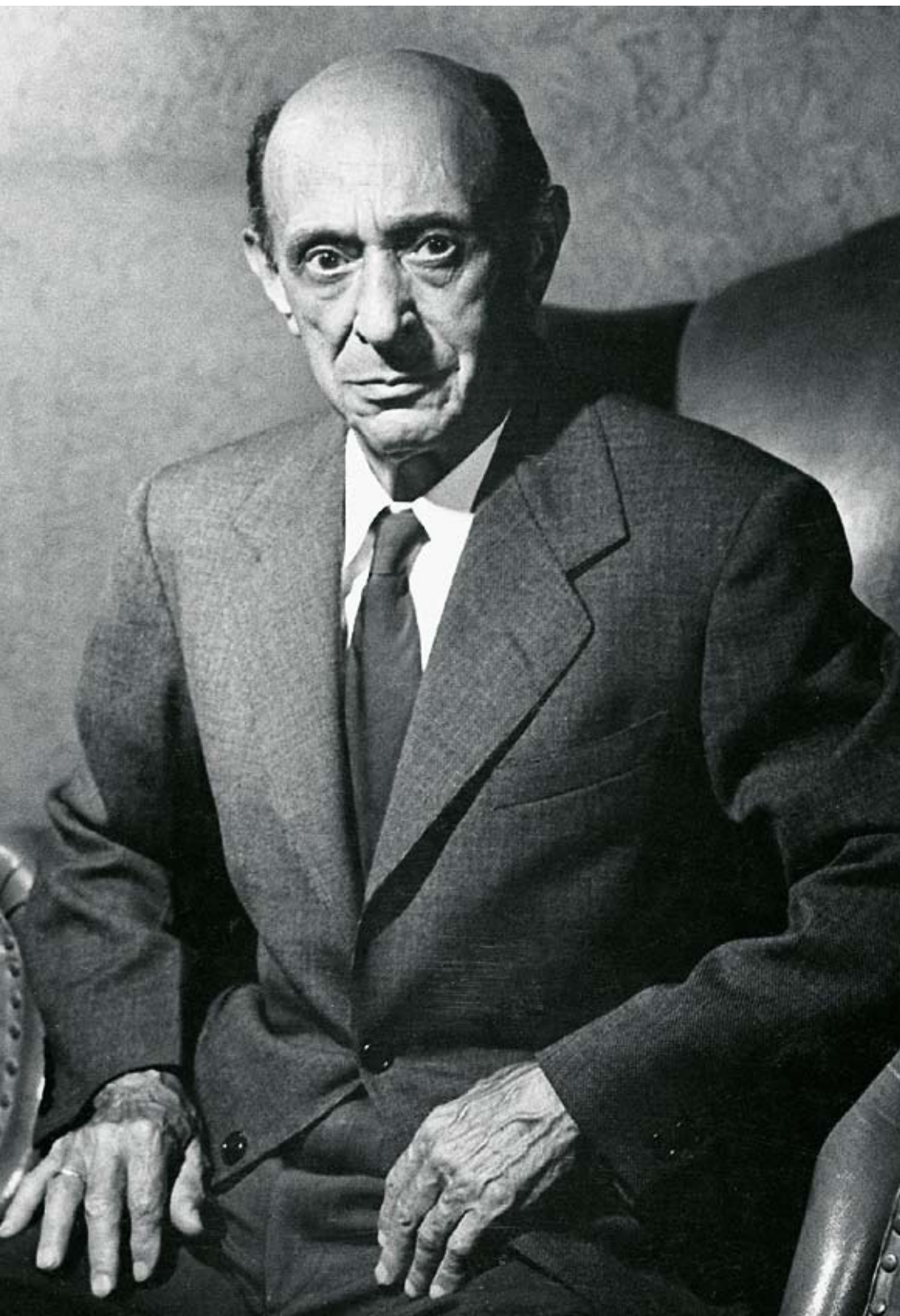
Im Rampenlicht der Musikgeschichte: der Komponist Arnold Schönberg (1874–1951).

genten und Kunstmäzen Paul Sacher unterstützt und ein Teil seiner Werke in der Schweiz uraufgeführt.