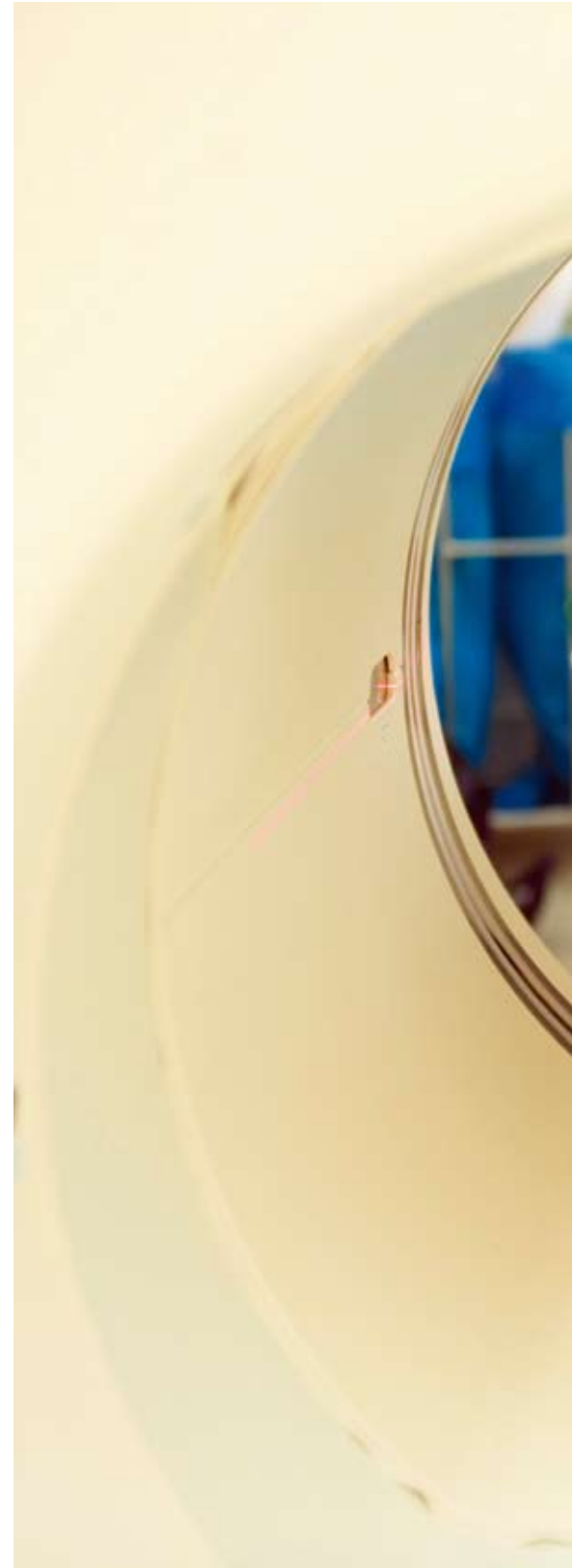
Diagnose Krebs? Das Immunsystem kann helfen,