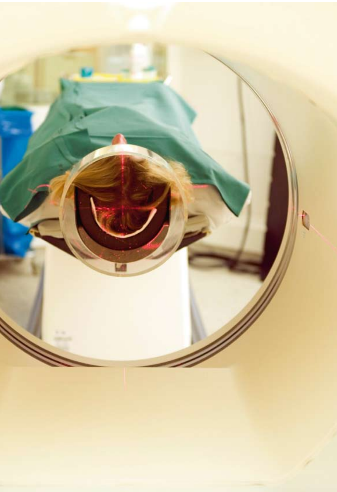
Tumore zu bekämpfen.