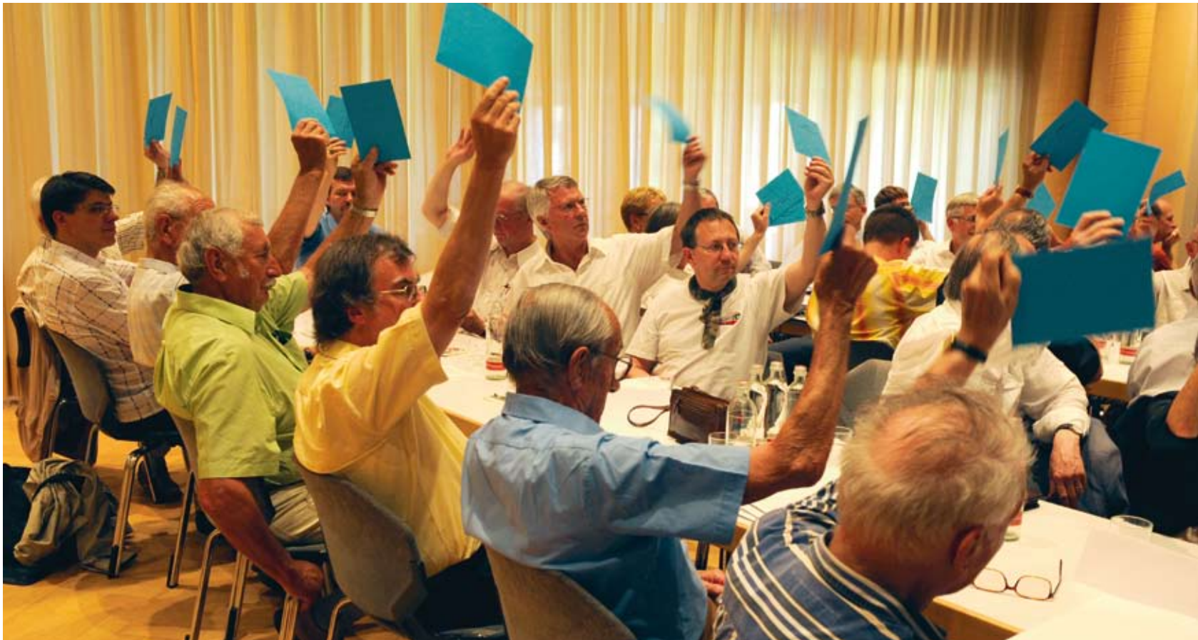
Kontrolle ist besser: Die Aktionäre sollten auch über die Entschädigung des Managements abstimmen können.